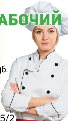
График работы 5/2 Адрес места работы: В.О., Косая линия д. 16

(мойка, уборка, помощь повару на кухне) з/пл 55 000-57 000 руб. с 07.30 до 16.00