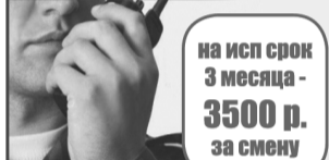
График работы: 1/3 (1/2, 2/2) з/п от 4 000 руб./смена 12 ч. - з/п 2 200 руб./смена 8 ч. - з/п 1 800 руб./смена

Официальное трудоустройство. З/п 2 раза в месяц. Помощь в лицензировании.