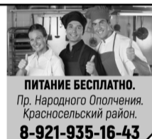
График по согласованию, с 8:00 до 17:00.

ПИТАНИЕ БЕСПЛАТНО. Пр. Народного Ополчения, Красносельский район. 8-921-935-16-43