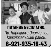
График по согласованию, с 8:00 до 17:00.

ПИТАНИЕ БЕСПЛАТНО. Пр. Народного Ополчения. Красносельский район. 8-921-935-16-43