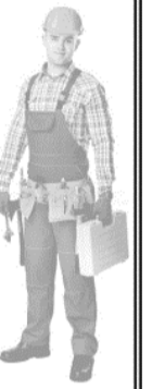
График: 3/3, 9.00-21.00. З/пл. 46 000 руб. Тел: 8-921-886-62-32

График: 5/2, 9.00-18.00. З/пл. 50 000 руб. Тел: 8-950-010-66-99