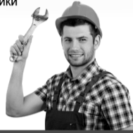
График работы 6/1, полный рабочий день. Оформление по ТК РФ.

- Ремонт электрической проводки строительной техники (экскаваторы) - Проведение ремонтных работ - Диагностика автомобильного электрооборудования - Техническое обслуживание дорожной техники - Выявление неисправностей - Устранение поломок - Мониторинг ситуации с наличием запасных частей и деталей