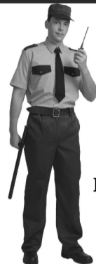
график работы: дневные и суточные смены, есть вахтовый метод, своевременные выплаты.

на торговых объектах — различные районы города.