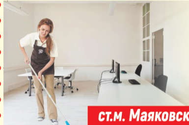
График работы: полный день с 08:00 до 17:00 с понедельника по пятницу.

Обязанности: уборка внешней территории, сбор и вынос мусора, полив и стрижка газонов, зимой - обработка реагентом, уборка снега и сколка льда.